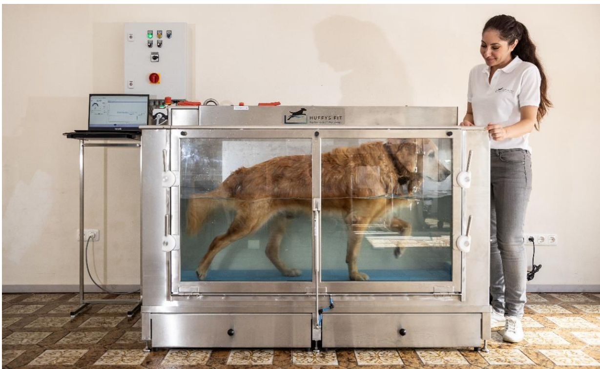
BU: Das innovative Unterwasserlaufband von HuffysFit für Hunde im Einsatz.

Kassel, 25.11.2022. Die ZOO & Co.-Fachmärkte in Gütersloh und Ettlingen warten ab sofort mit einer absoluten Neuerung im Bereich Tiergesundheit auf – dem Unterwasserlaufband von HuffysFit. Hunden und ihren Besitzer*innen steht nun in teilnehmenden Fachmärkten, unter fachlicher Anleitung, ein innovatives Physiolaufband zur Steigerung der Fitness oder dem Muskelaufbau zur Rehabilitation nach Operationen von Hunden zur Verfügung. „Diese Sport- und Bewegungstherapie ist wie ein Besuch im Fitnessstudio für Hunde, denn durch regelmäßige Trainingseinheiten erhöht sich nicht nur die körperliche Fitness der Tiere, sondern auch die Lebensqualität“, so Jochen Huffnagel, der Gründer und Inhaber von HuffysFit.