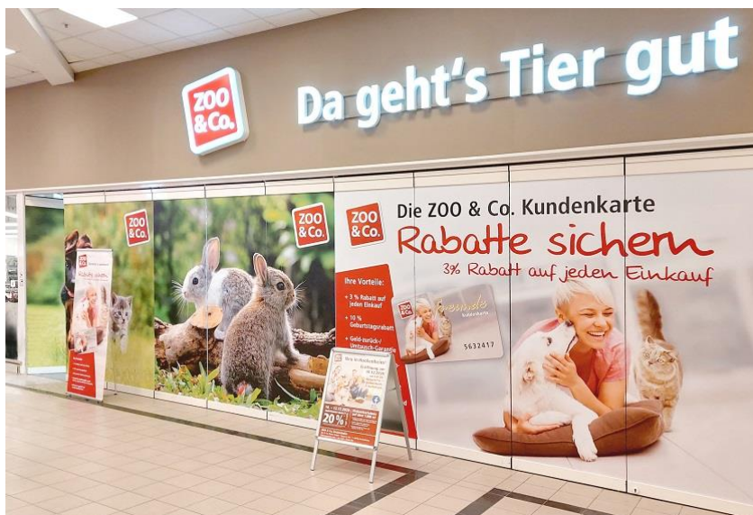
BU: Der neue ZOO & Co.-Fachmarkt befindet sich im Globus-Einkaufscenter